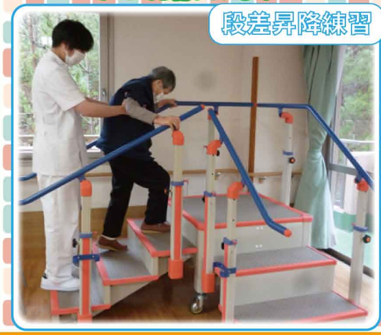
介護老人保健施設あいあい三郎丸 (入所 サービス ティー7 訪問介護 居宅介護支援 老人介護支援センター)