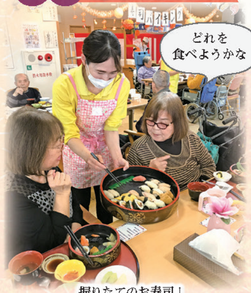
握りたてのお寿司！