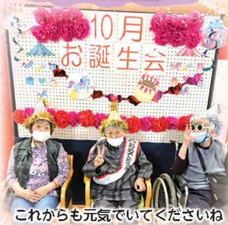
これからも元気でいてくださいね