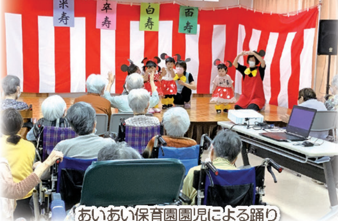
あいあい保育園園児による踊り