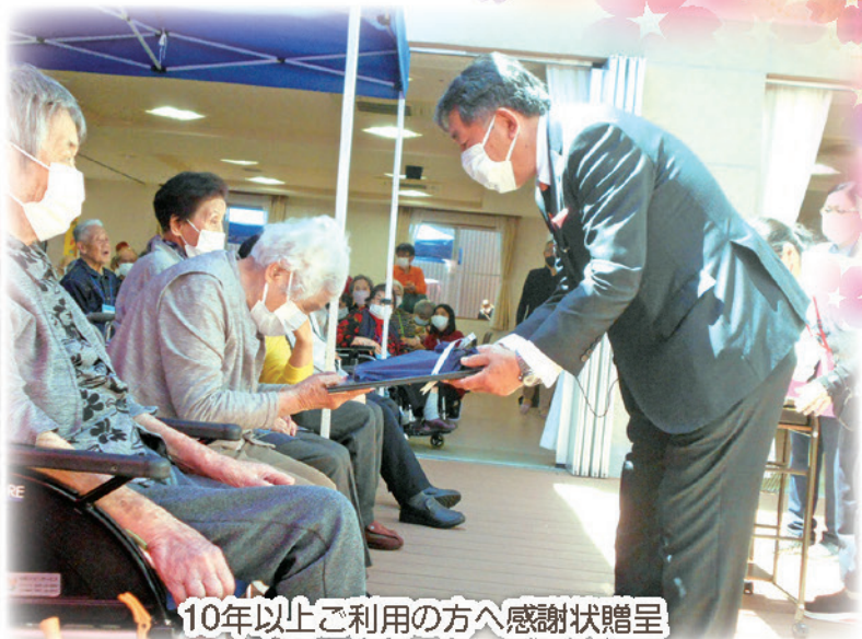
10年以上ご利用の方へ感謝状贈呈