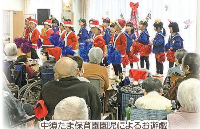
中須たま保育園園児によるお遊戯