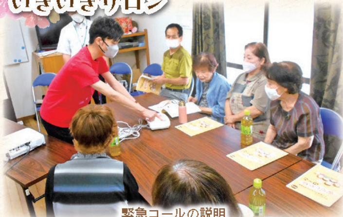
緊急コールの説明