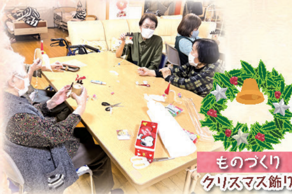
ものづくり クリスマス飾り