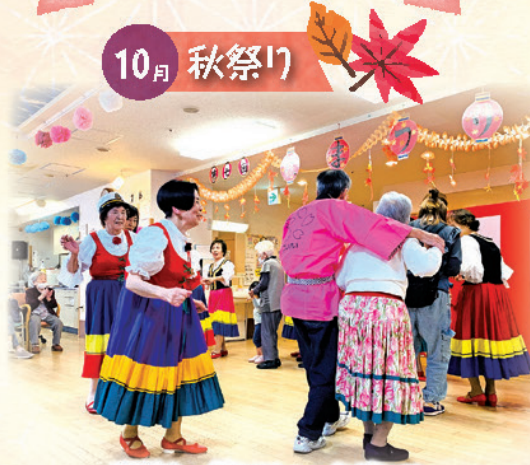
職員も一緒にフォークダンス