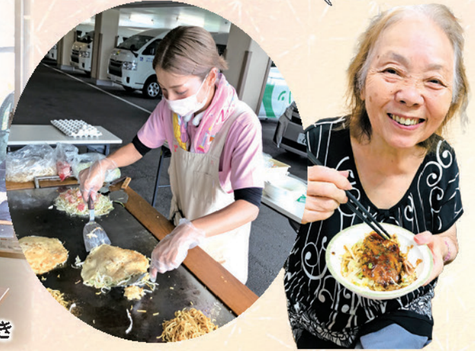
鉄板で焼いた広島焼き