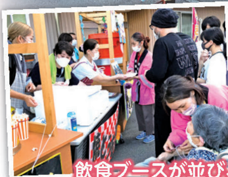
飲食ブースが並び、ご利用者やご家族のみなさんで楽しめました。