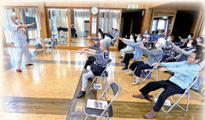
理学療法士が出張します