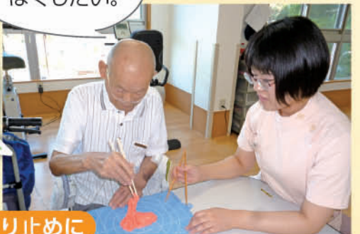
輪ゴムをつけてすべり止めに