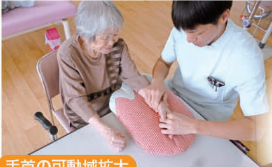
手首の可動域拡大