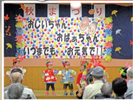
あいあい保育園(お遊戯)