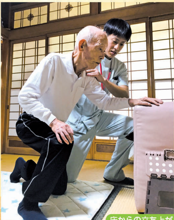
床からの立ち上がり