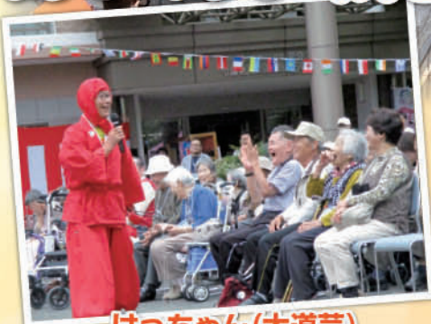
はっちゃん(大道芸)