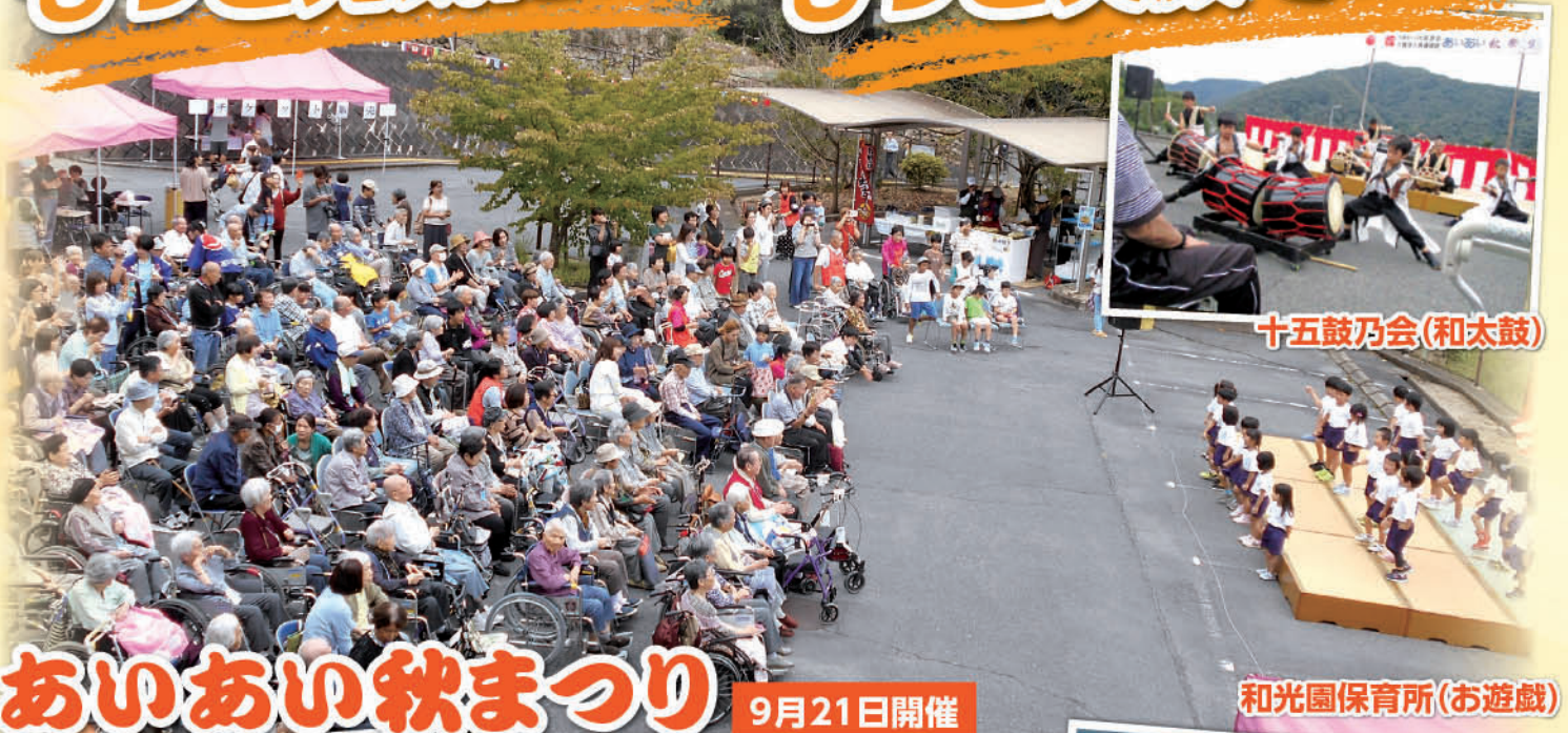
十五鼓乃会(和太鼓)