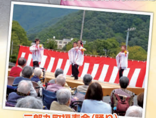
三郎丸町福寿会(踊り)