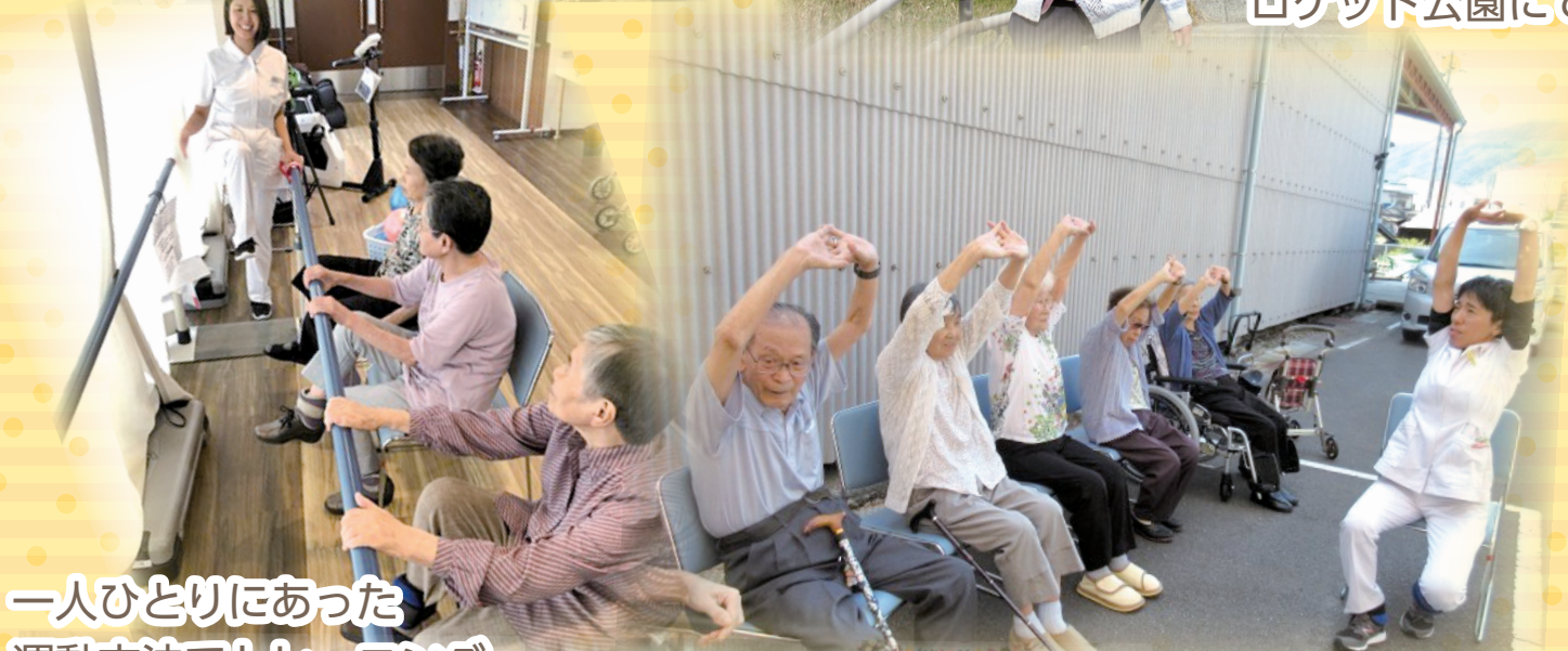
一人ひとりにあった運動方法でトレミシグ