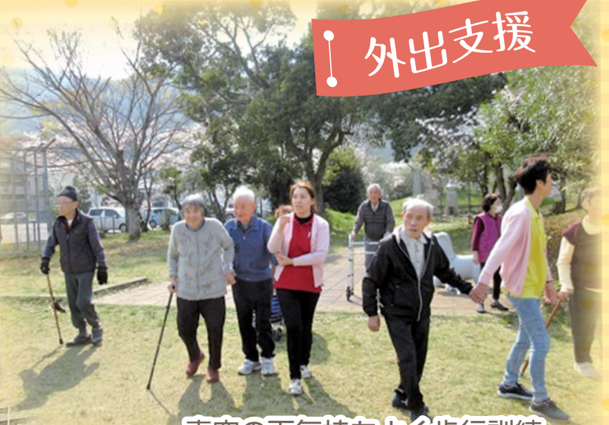
青空の下気持ちよく歩行訓練