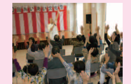
療法士による五感を働かせながらの体操