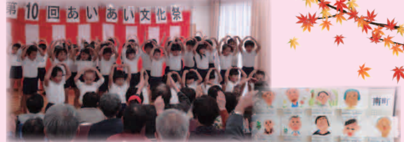
和光園の園児たちによるお遊戯と 入所者似顔絵のプレゼント♪