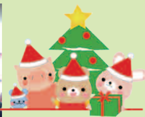
和光園の園児による 歌や踊りの発表があります