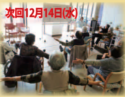
体育の授業の様子(心も体もリフレッシュ)

「作業療法士」が、 唱歌に合わせての体操や しっかり手指を動かす作品 作り等の指導しています。