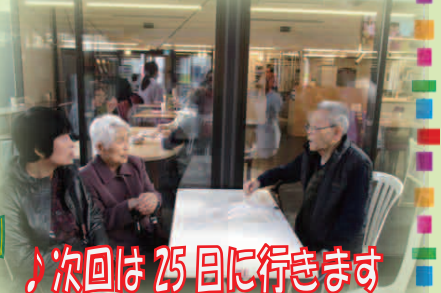
皆さん、たくさんの商品を見られたり 談笑され、とても楽しめました。