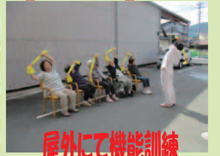
屋外にて機能訓練

介護認定をお持ちの方 デイ無料体験できます。 お気軽にお問合せください。 TEL (0847)45-1600