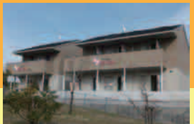
職員アパート(独身用)があります

募集職種：介護職員 試験日時：平成28年9月17日(土) 午後1時30分～筆記・作文・面接 試験会場：ケアホームあいあい府中駅西(府中市府中町102番地の1) 対象：高校・専門学校・短大・大学を来春卒業予定の方 採用予定日：平成29年4月1日 応募方法：9月15日までに、いずれかの施設へ履歴書(写真貼付)を ご郵送又はご持参ください。